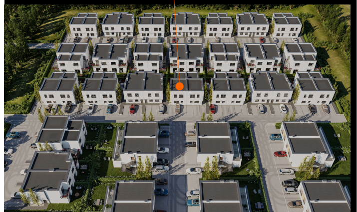
BUDYNEK 36K. lokal II

UL. PŁONOWA 36K NOWA WOLA - 59,5 m 2 KONDYGNACJA - PIĘTRO