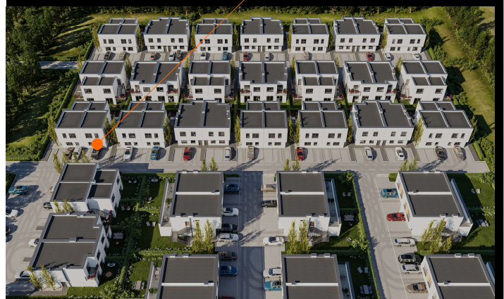
BUDYNEK 36E. lokal I

UL. PŁONOWA 36E NOWA WOLA - 57,1 m 2 KONDYGNACJA - PARTER