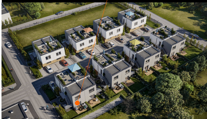
BUDYNEK 15. lokal I

UL. MALWY 15/1 NOWA WOLA - 46,4 m 2 KONDYGNACJA - PARTER